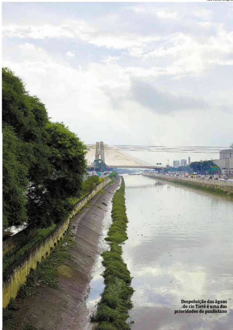
Despoluição das águas do rio Tietê é uma das prioridades do paulistano

No entanto, será preciso driblar o sentimento de descrença do paulistano. Enquanto 93% das pessoas consultadas acham o SP2040 uma iniciativa boa ou excelente, apenas 4% acreditam que ela será completamente executada, e 55% creem que terá pequena ou nenhuma