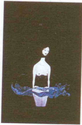
Capa: acrílica sobre tela de Herbert Baglione, 2010

A riqueza é algo importante, seja do ponto de vista dos afetos ou do consumo – e a edição que apresentamos aqui é rica nos dois temas. Rica em olhares, em reflexões, em críticas e em especialistas. Para que o seu olhar seja ele também rico.